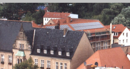
Foto: 1. Bürgersolaranlage Eberswalde GbR Bürgersolaranlage Eberswalde.