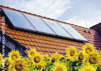
Solarthermieanlagen zur Warmwasserbereitung und Heizungsunterstützung.

Mehr ... http://www.erneuerbar.barnim.de/singelview-News.2749+M558afdb910f.0.html