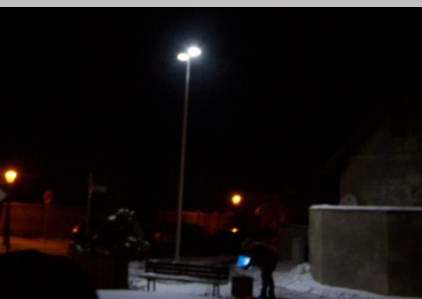
Zwei LED-Leuchten (mitte) wurden zu Demonstrationszwecken in Wandlitz aufgestellt.

Besuchen Sie auch unsere Dauerausstellung: Brunnenstraße 26, Eberswalde. Die Öffnungszeiten erfahren Sie unter www.eiche-brbg.de .